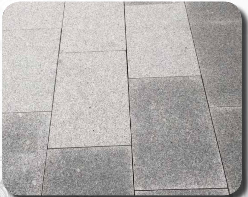
Vergleich mit und ohne MAPESTOP Behandlung