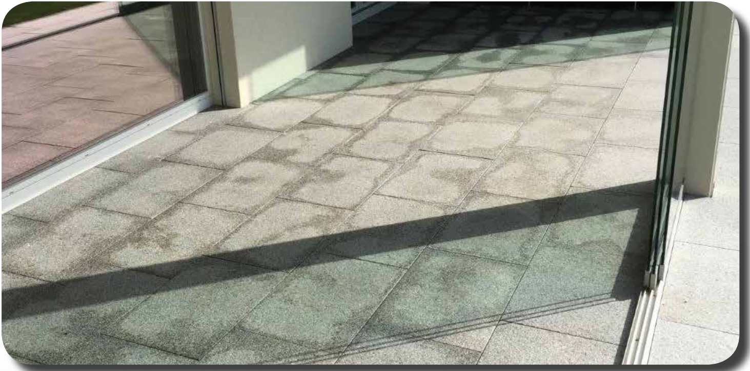
unästhetische Feuchtflecken / Hell-Dunkel-Erscheinung